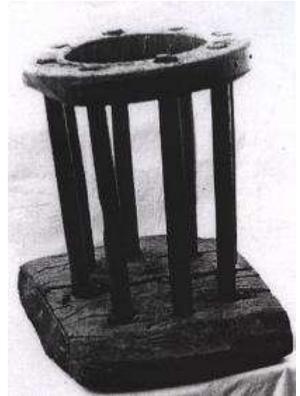
Il girello di legno